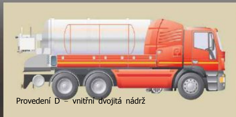
Provedení D – vnitřní dvojitá nádrž