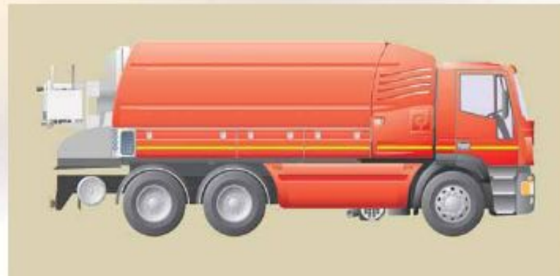
Provedení V – boční polyetylenové nádrže

Řada Elegance nabízí tři různá provedení vodních komor: boční polyetylenové nádrže, přední nádrž a dvojitá vnitřní nádrž.