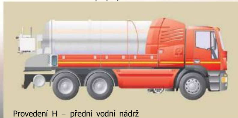
Provedení H – přední vodní nádrž